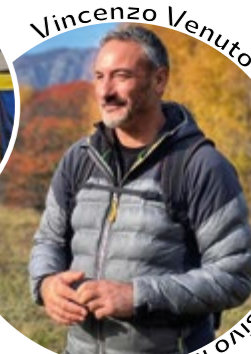
Vincenzo Venuto - conduttore televisivo Melaverde